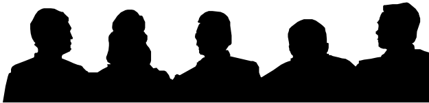
輸血部からのおねがい 2

ちなみに9月の転用数は、PC10 単位 3 本、5 単位 1 本、LPRC2 単位 1 本。10 月は PC10 単位 7 本、LPRC2 単位 1 本でした。この 2 ヶ月間で約 80 万円の損失を回避したことになります。